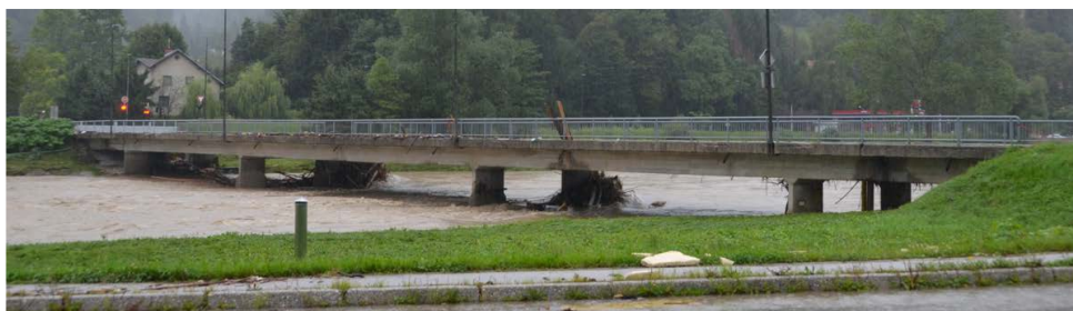
Slika 2: Obstoječa premostitev ob visokem vodostaju reke Savinje

Trenutna premostitev reke Savinje na Polulah je prenizka ter je hidravlično neustrezna, saj je most ob visokih vodostajih reke Savinje poplavljen. Nova rešitev predvideva premoščanje reke brez podpor v njeni strugi ter z ustrezno višjo niveleto, kar zagotavlja hidravlično primerno rešitev.